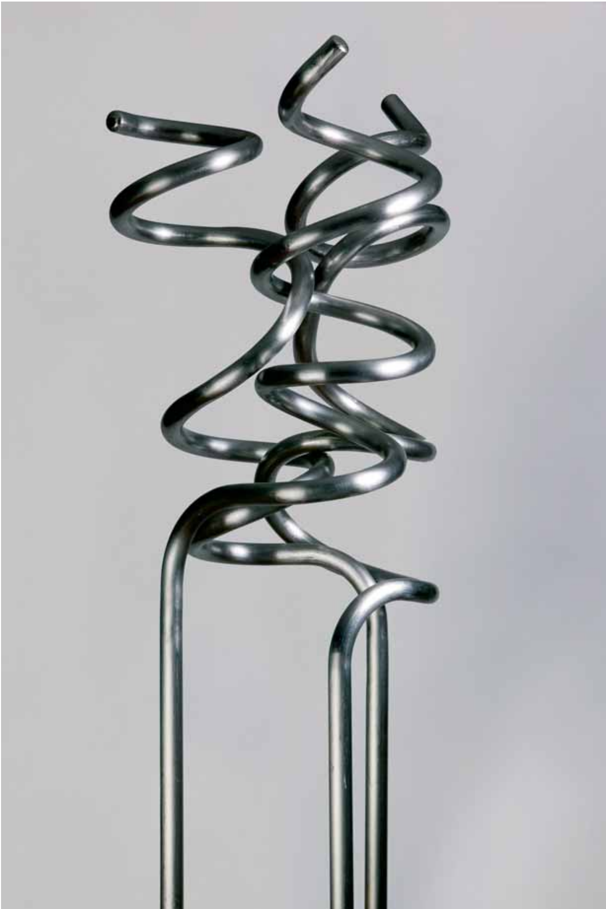
DETALLE "NUESTRO COMPROMISO" DETAIL OF "OUR COMPROMISE" Acero inoxidable curvado / Stainless curled steel